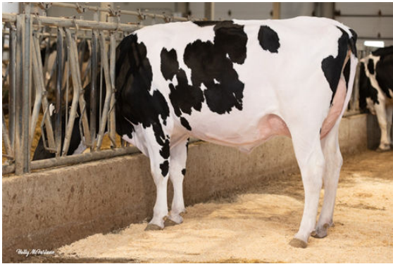
PROGENESIS CONWAY PRESLEY DAM